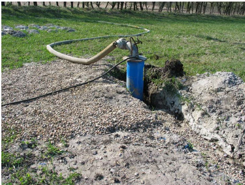
Prøve pumpning af ny boring