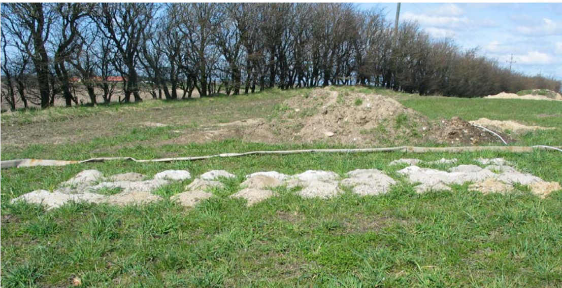
Jord prøver fra ny boring, 1 prøve for hver 3 meters dybde