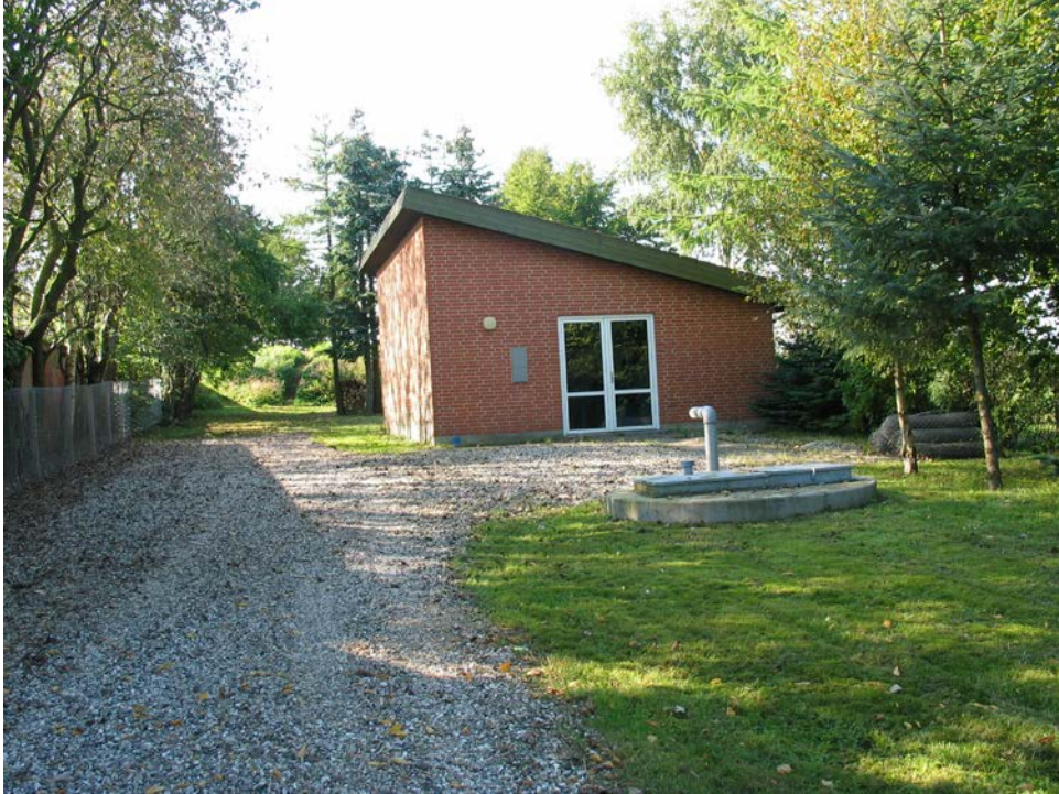
Kvorning Vandværk i dag